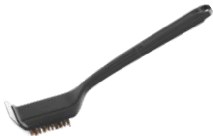
BROSSE À GRIL AVEC FILAMENTS DE PALMYRE