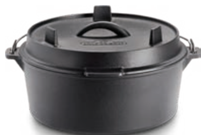
COCOTTE EN FONTE