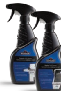
NETTOYANT POUR GRIL INTÉRIEUR/EXTÉRIEUR