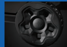
Roues robustes et tout-terrain