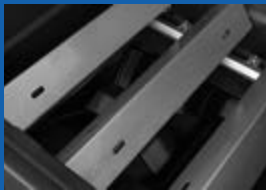
Diffuseurs en acier inoxydable