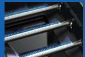
Brûleurs en acier inoxydable