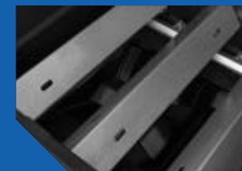
Diffuseurs en acier inoxydable