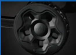
Roues robustes et tout-terrain