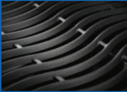
Grilles de cuisson WAVE TM emblématiques