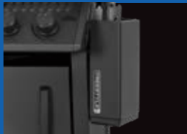
Tablette latérale rabattable