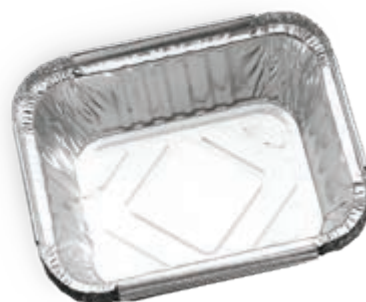
PAQUET DE 5 PLATEAUX D'ÉGOUTTEMENT