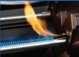
Allumage instantané JETFIRE MC