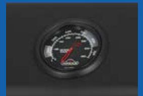
Jauge de température ACCU-PROBE MC