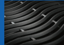
Grilles de cuisson WAVE MC emblématiques en fonte émaillée