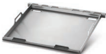
PLANCHA ACCESSOIRE EN ACIER INOXYDABLE