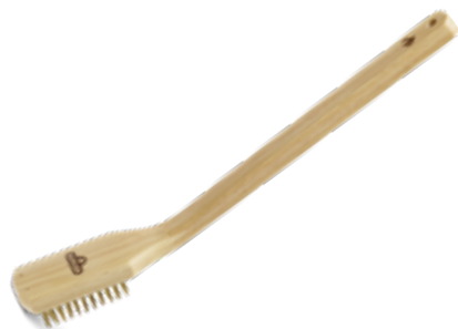
BROSSE À GRIL AVEC FILAMENTS EN LAITON