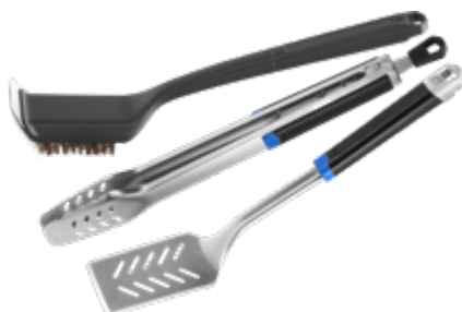
ENSEMBLE DE TROIS USTENSILES