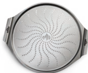
PLATEAU À PIZZA