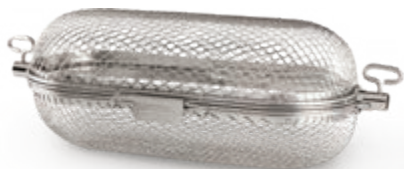
PANIER POUR RÔTISSOIRE