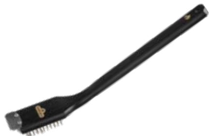
BROSSE À GRIL AVEC FILAMENTS EN ACIER INOXYDABLE