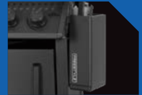
Tablettes latérales rabattables