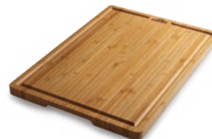
PLANCHE À DÉCOUPER EN BAMBOU