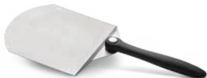
SPATULE À PIZZA