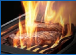
Brûleur latéral infrarouge SIZZLE ZONE MD