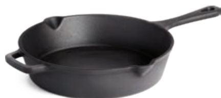
POÊLE À FRIRE EN FONTE