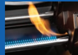
Allumage instantané JETFIRE MC