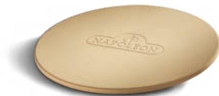
PIERRE À PIZZA