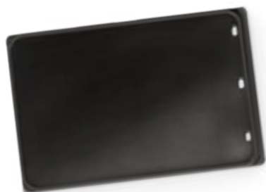
PLANCHA ACCESSOIRE EN FONTE

Transformez facilement votre grill avec notre plancha accessoire en acier inoxydable de qualité. Idéale pour saisir et faire sauter les aliments, cette plancha offre une grande surface de cuisson pratique. Vous pouvez saisir parfaitement un bifteck, cuire des hamburgers juteux, préparer un déjeuner complet, et plus encore. Profitez d'une expérience de cuisson fiable grâce à la conception en acier inoxydable épais et à la répartition uniforme de la chaleur. De plus, les collecteurs de graisse intégrés recueillent les écoulements pour faciliter le nettoyage. Économisez de l'espace et de l'argent en transformant votre grill existant en plancha en un clin d'œil.